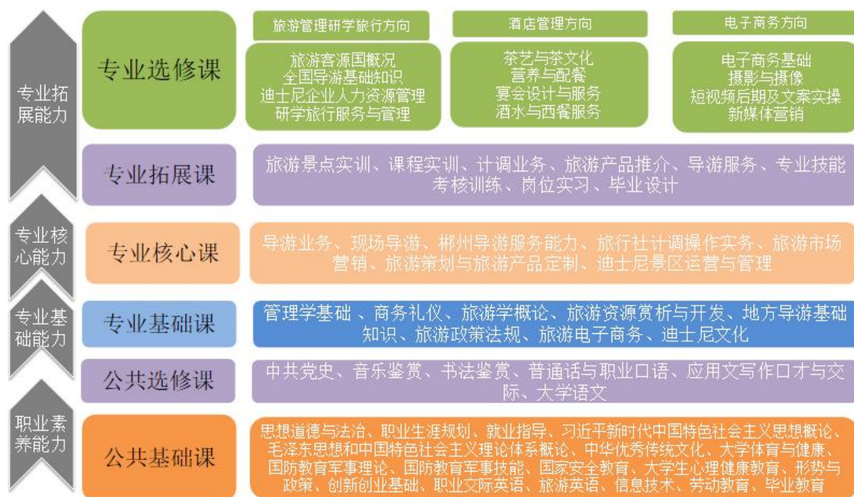
图 1 基于职业能力分析构建的课程体系

通过对旅游管理专业相关企业及上海迪士尼度假区对人才需求的调研，将企业岗位设置及职业能力进行梳理，依据能力层次划分课程结构，整合具有交叉内容课程，结合人才培养目标，本专业课程设置有公共基础课、专业基础课、专业核心课、专业拓展课及选修课（公共选修课与专业选修课）等 5 类课程，总共 49 门课。