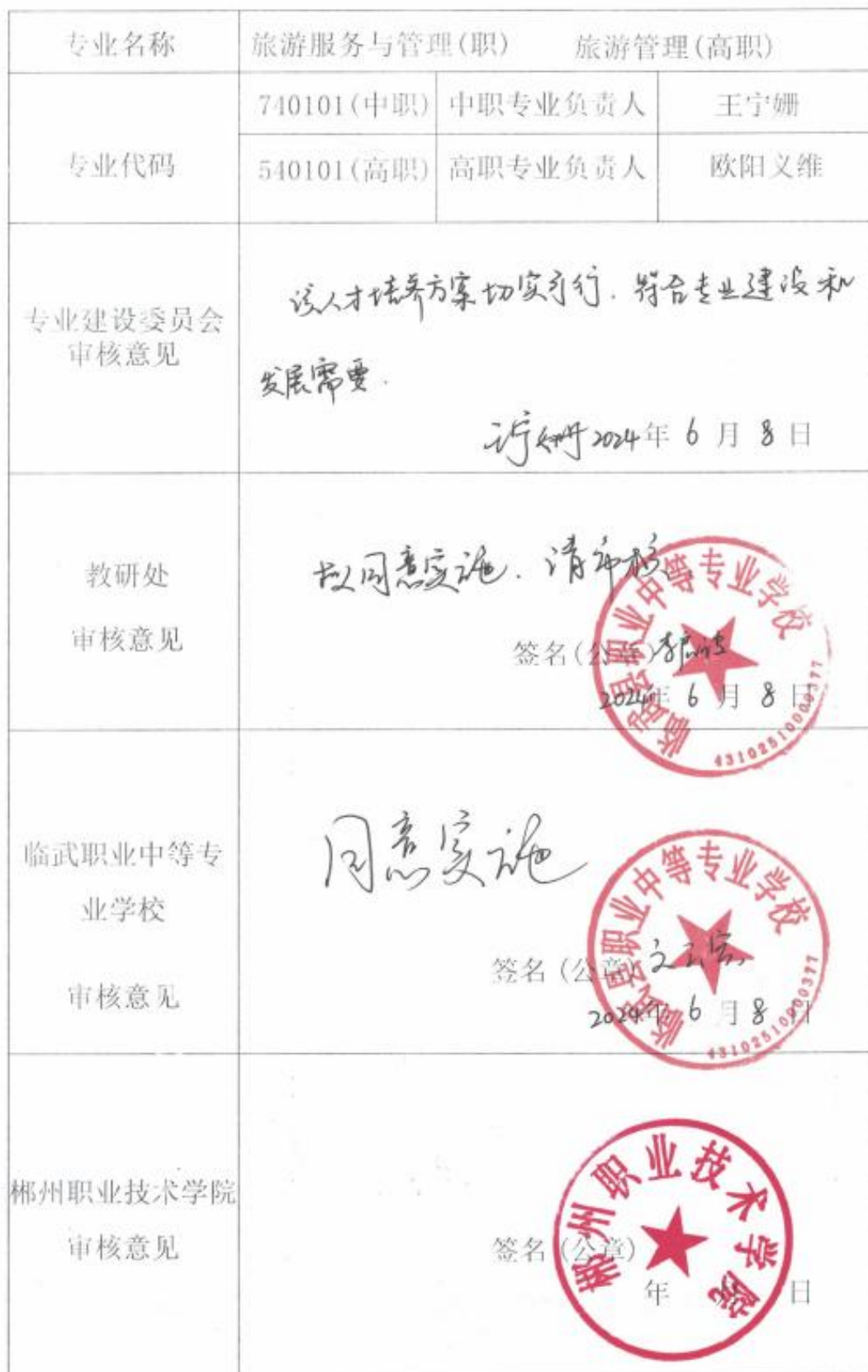
2024级三二分段人才培养方案制定审批表