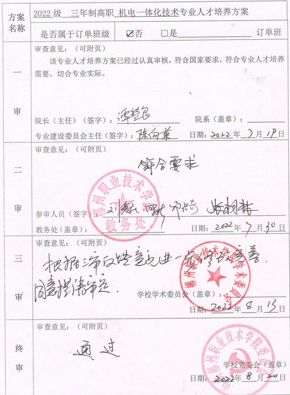
郴州职业技术学院专业人才培养方案制定审批表