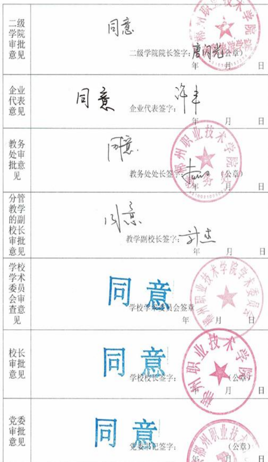
人才培养方案审批表