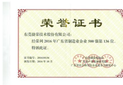
广东省 500 强证书