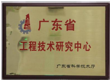
广东省工程技术研究中心