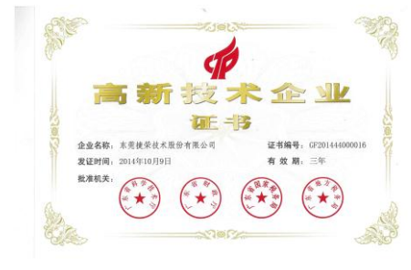
高新技术企业证书